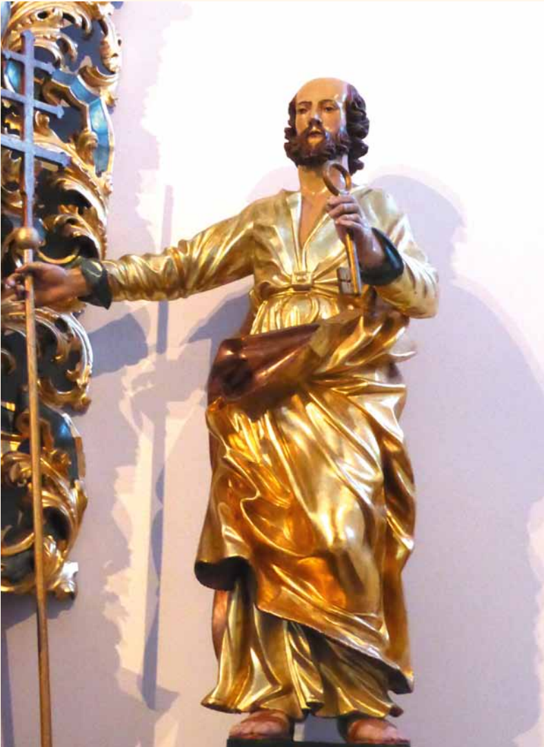
Heiliger Petrus